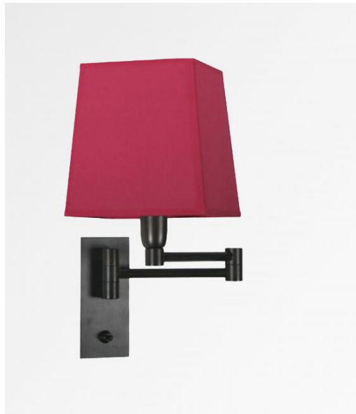
AHMOSIS +SW en bronze griffé avec abat-jour en Bombay flash (tissu de catégorie 1)