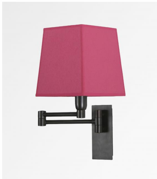
AHMOSIS -SW en bronze griffé avec abat-jour en Bombay flash (tissu de catégorie 1)