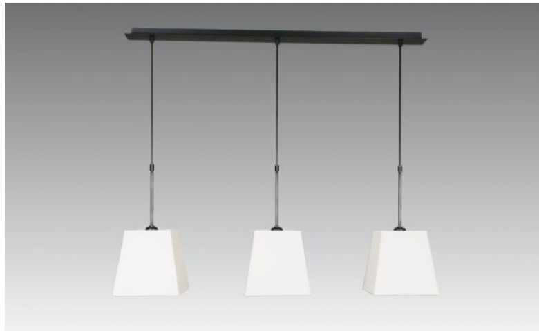
ARSINOE # en bronze griffé avec abat-jour en Chinette ivoire (tissu de catégorie 0)