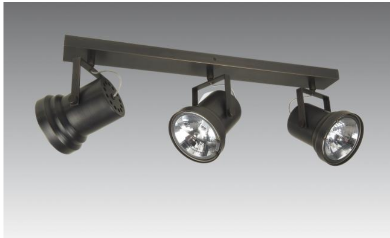
ATHENA 3 en bronze griffé