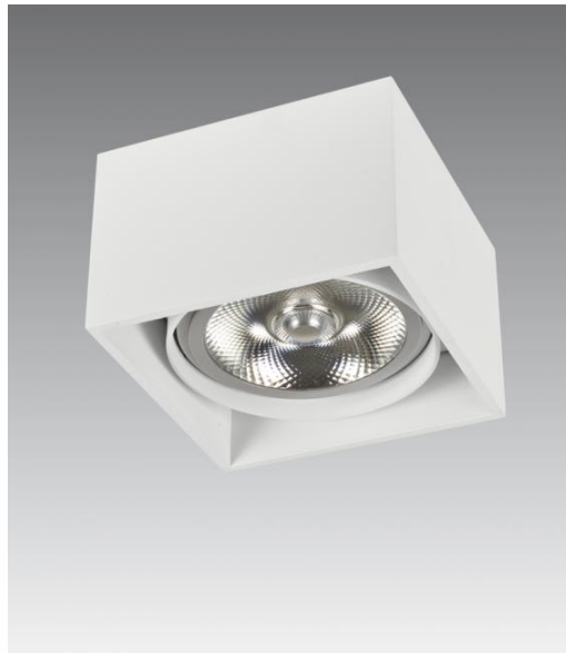
ATRIA 1 FIXE en blanc structuré