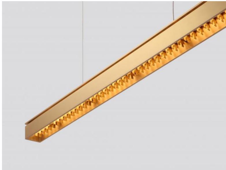
GALAND J ø en laiton satiné