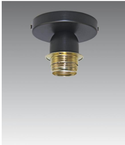
KENTIKA MINI en bronze griffé