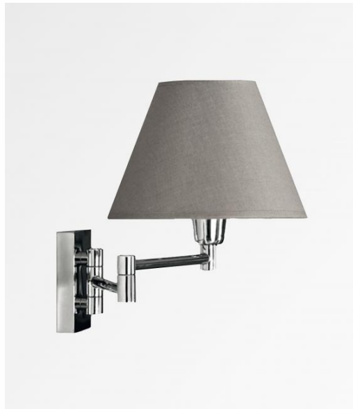
MAMMISI -SW en chrome poli avec abat-jour en Coton gris (tissu de catégorie 1)