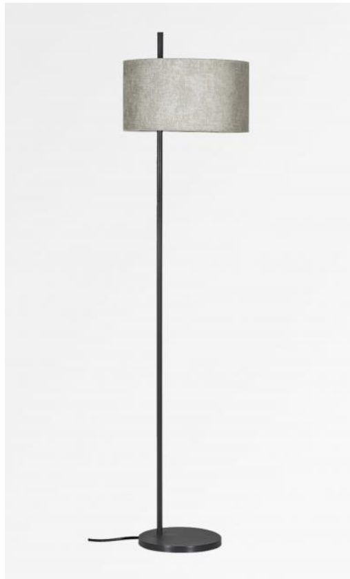
MENDES FLOOR en bronze griffé avec abat-jour en Trento ficelle (tissu de catégorie 3)