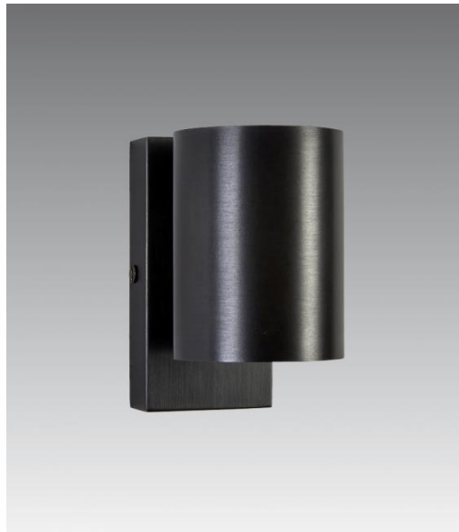
MERAK 1 en bronze griffé