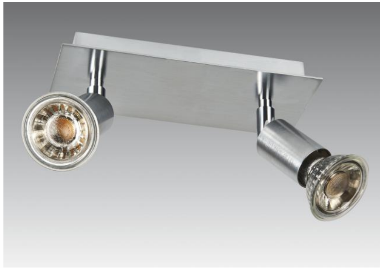
MERCURE 2 en chrome satiné