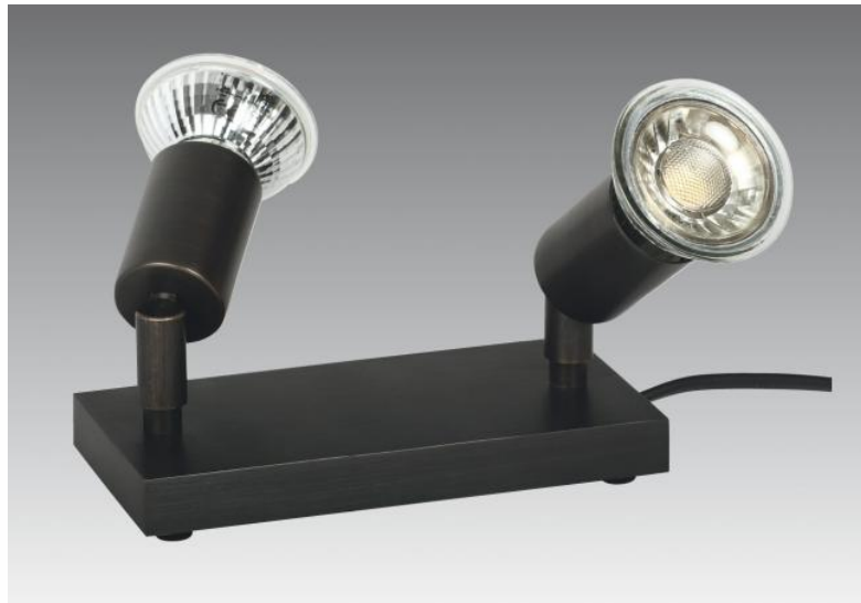
MERCURE PL2 en bronze griffé