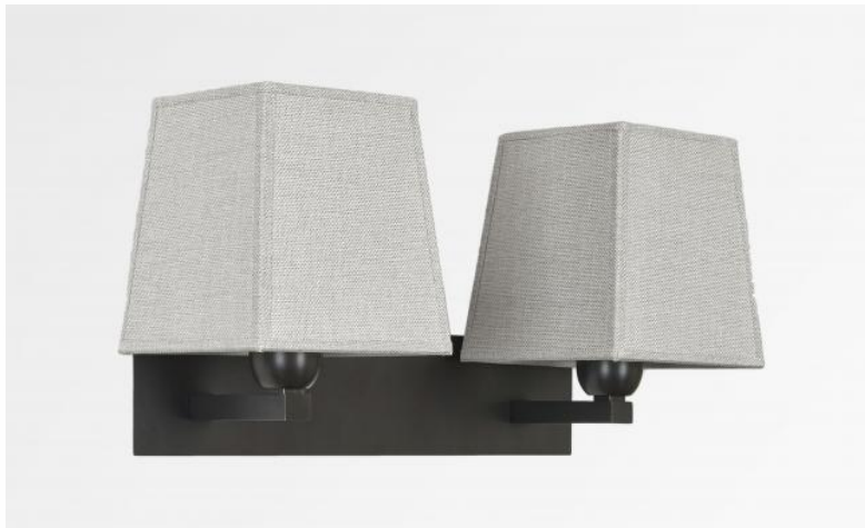
MONTOU en bronze griffé avec abat-jour en Dreams bambou (tissu de catégorie 2)