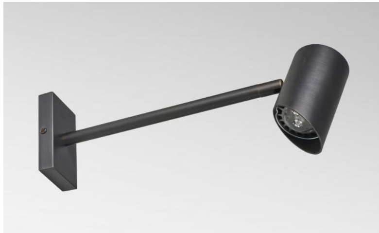
PALMA en bronze griffé