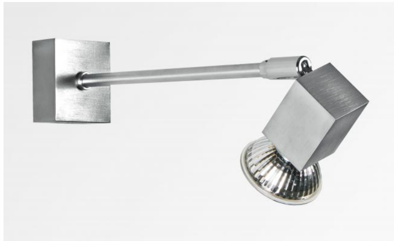
PEGASE en chrome satiné