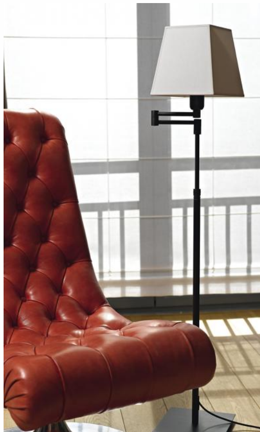
REKMARE en bronze griffé avec abat-jour en Coton calcaire (tissu de catégorie 1)