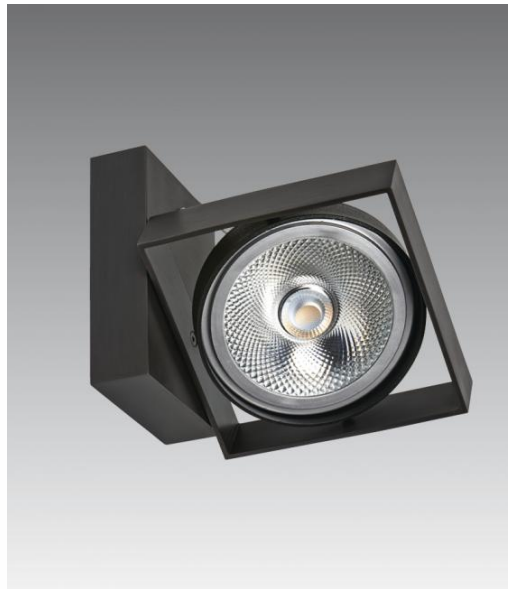
SARGAS 1 en bronze griffé