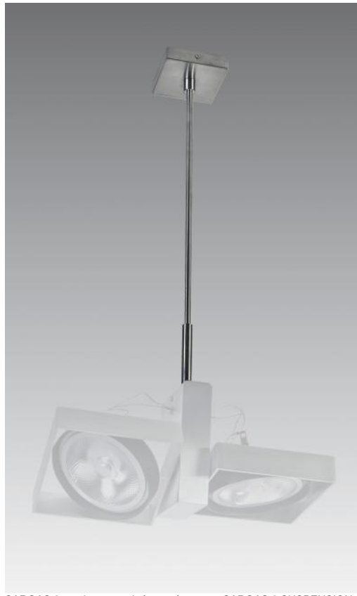
SARGAS 2 en chrome satiné monté sur une SARGAS 2 SUSPENSION