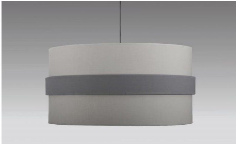
Abat-jour TOUYA 45 en Coton gris avec anneau en Coton schiste (tissu de catégorie 1)