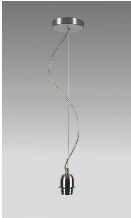
SUSPENSION STEEL CABLE en nickel satiné