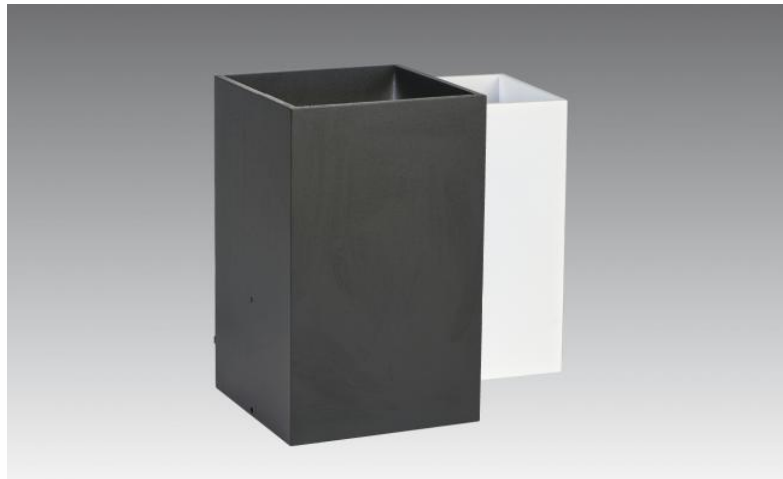
UP 111 en noir et blanc structuré