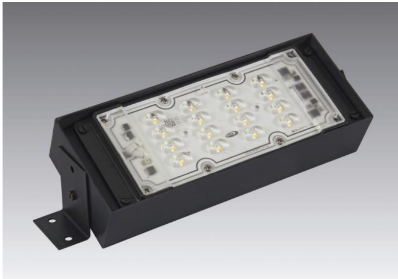
UP 300 en bronze griffé