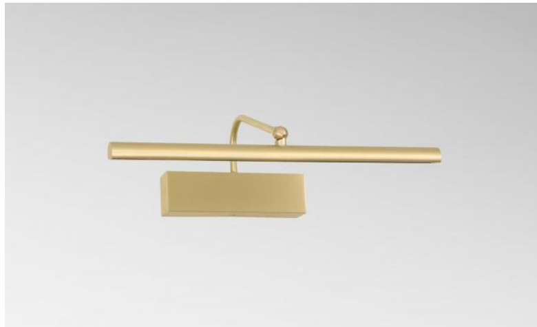
VERSAILLES 35 en laiton satiné